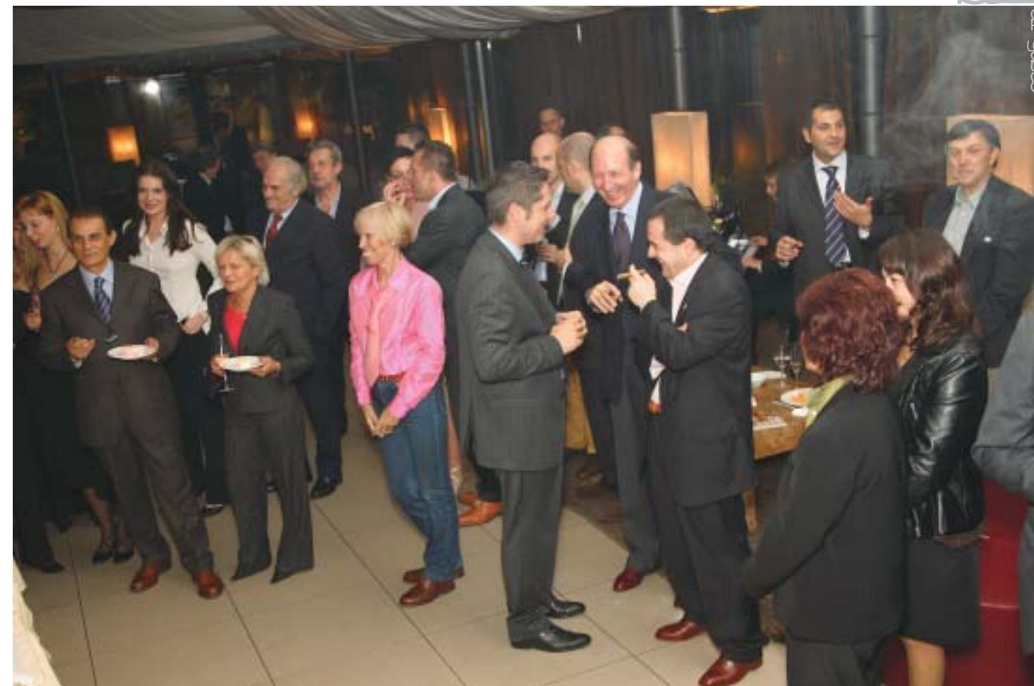
la serata dopo il taglio della torta.

Miscela (con elevata percentuale di ligero, quindi piuttosto forte) di tabacchi selezionatissimi della valle del Cibao e capas sempre equadorenas sun grown fer-