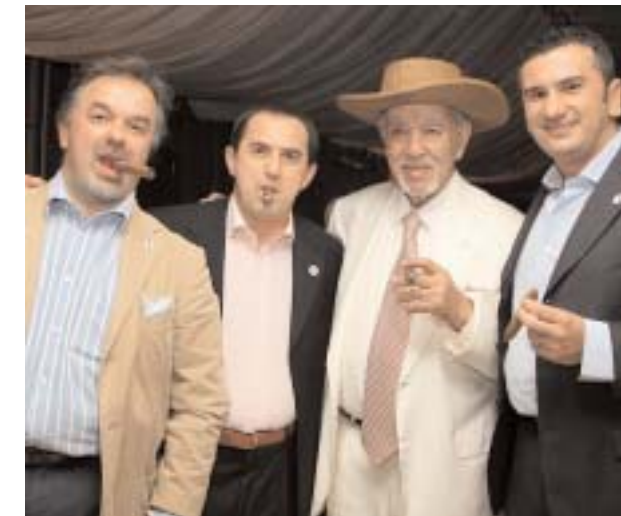
Alcuni ospiti della serata al Grand Visconti Oalace di Milano